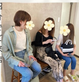
セルフ脱毛女子会