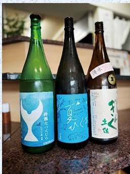
夏期限定の日本酒